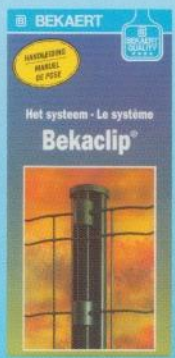
Conseils de pose