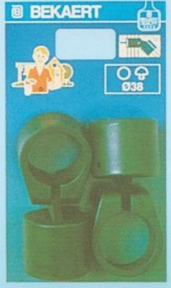
Colliers pour jambes de force sous blister (par 2)