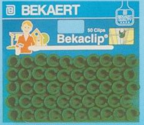
Clips (par 50) sous blister